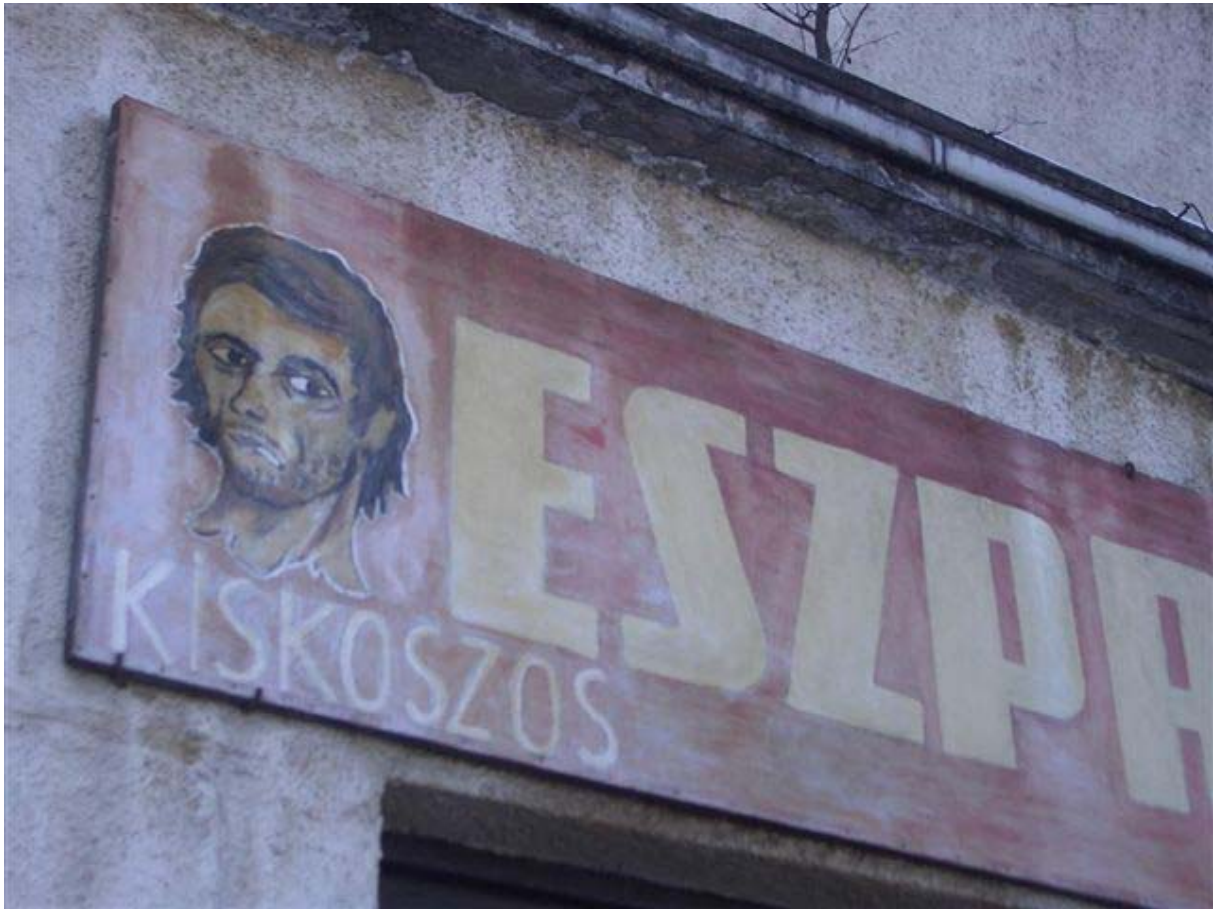
A tér hangulata

Képviselőikhez meglepő indítvánnyal fordultak: „Arra kérjük önöket, hogy minket képviseljenek...”