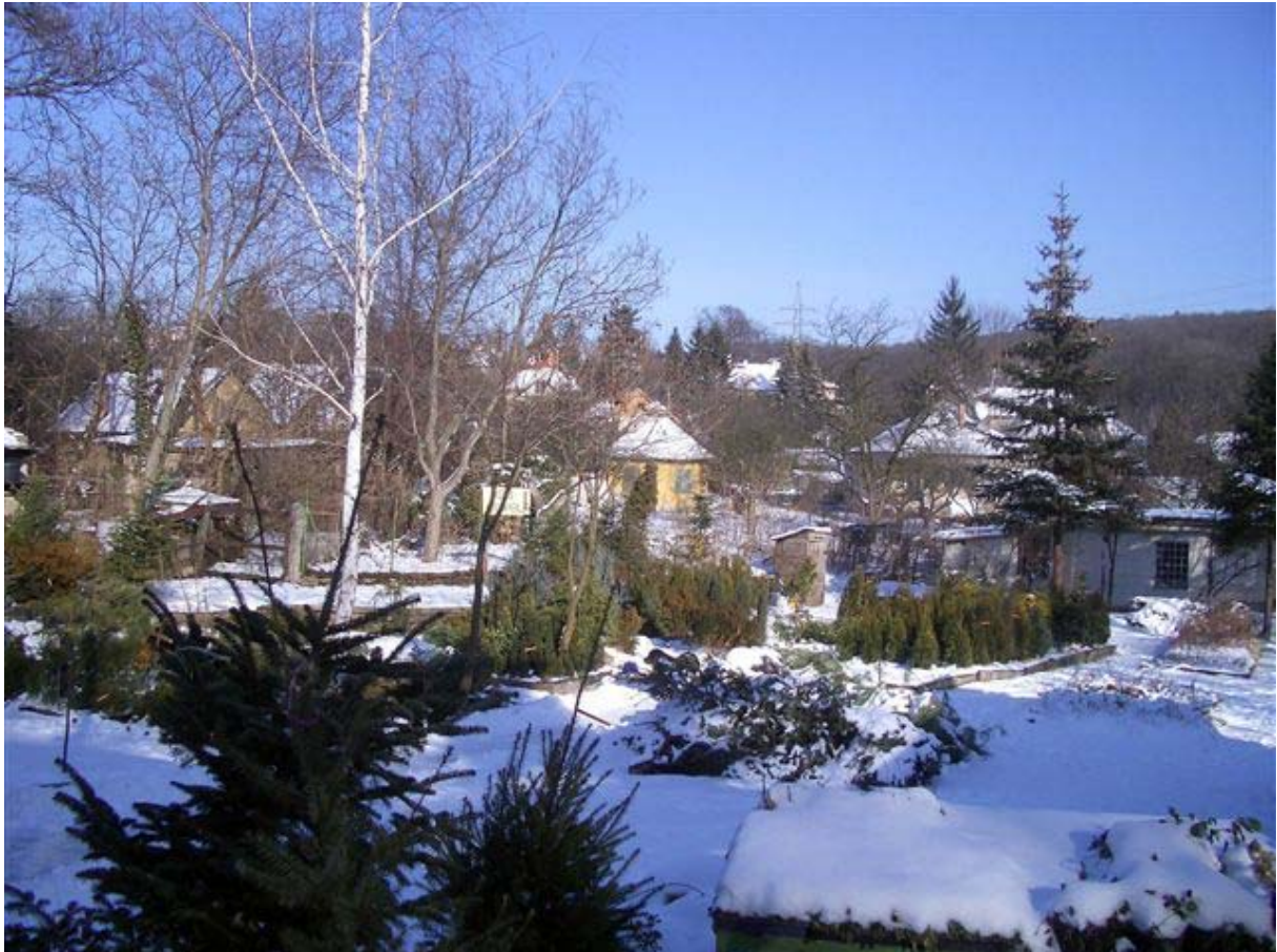
A szolgáltatóközpont számára kijelölt hely

célja, építészeti és kereskedelmi szempontból a kor követelményeinek megfelelő szolgáltató központ létrehozása úgy, hogy annak megvalósítása a résztvevők számára a leg gazdaságosabb legyen.” 4 Az együttműködés másik hiányossága a kereskedők szemszögéből az az önkormányzati álláspont, hogy ide mindenképp szolgáltatóházat akarnak építeni. Ez már nevéből is adódóan több szintes épületet feltételez, ami nem igazán igazodik a környék kertvárosi stílusához. A kereskedők sétálóutcás, földszintes épületekből álló elképzelése sokkal inkább megfelelne. 5 Az üzletek tulajdonosai és bérlői maguk is elszomorítónak találják a tér mai állapotát, és akár önerőből is hajlandóak lennének felújítani épületeiket, az Önkormányzat azonban másban gondolkozik.